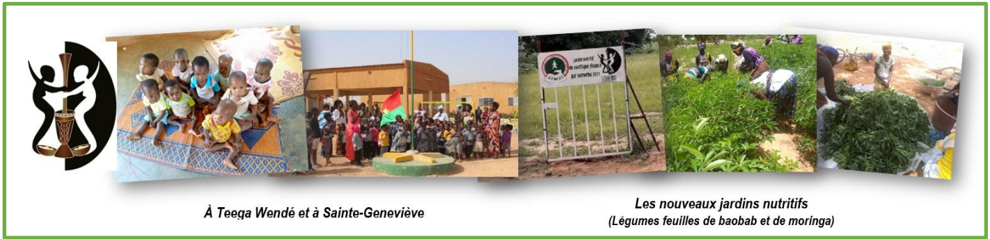
À Teega Wendé et à Sainte-Geneviève