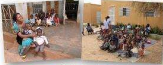
A Teega Wendé et à Sainte-Geneviève