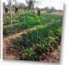
Maraîchages de Koassa, Niességa et Tithon

En raison de la situation politique au Burkina Faso, notre voyage prévu en février 2019 a dû être annulé. Cette situation perdure aujourd'hui et il s'y ajoute le contexte très particulier que nous subissons tous du fait de la pandémie mondiale du COVID 19. Il nous est donc toujours impossible de nous rendre sur place.