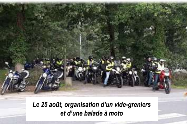
Le 25 août, organisation d'un vide-greniers et d'une balade à moto