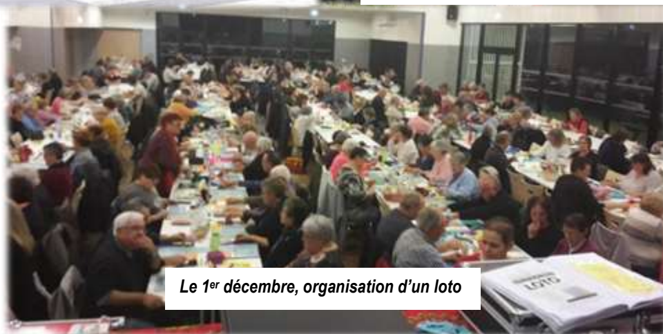
Le 1 er décembre, organisation d'un loto