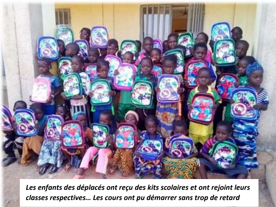
Les enfants des déplacés ont reçu des kits scolaires et ont rejoint leurs classes respectives... Les cours ont pu démarrer sans trop de retard

Sainte-Geneviève a fait l'acquisition d'un car pour faire la liaison, matin et soir, entre l'école et les familles déplacées qui sont logées loin de Yako (entre 6 et 10 km).