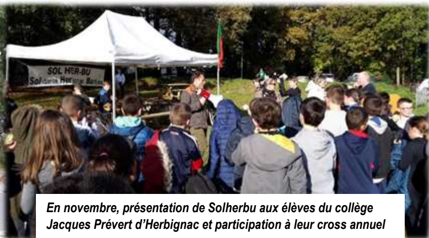
En novembre, présentation de Solherbu aux élèves du collège Jacques Prévert d'Herbignac et participation à leur cross annuel