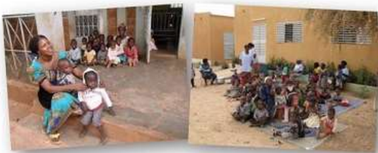
A Teega Wendé et à Sainte-Geneviève