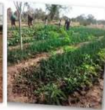
Maraîchages de Koassa, Niességa et Tithon